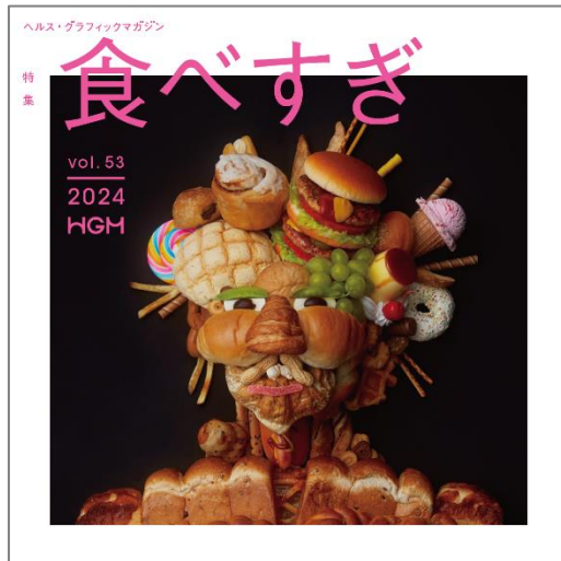
HGM Vol.53「食べすぎ」号 表紙