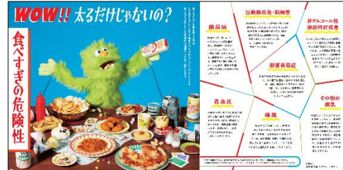
pp.8-9 WOW!! 太るだけじゃないの? 食べすぎの危険性