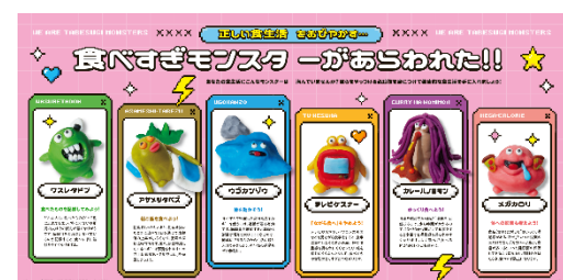
pp.16-17 食べすぎモンスターがあらわれた!!

「朝ご飯を食べない」、「ながら食べ」、「早食い」など、あなたの食生活に“食べすぎモンスター”は潜んでいませんか？ 健康的で正しい食生活をおびやかす6つの習慣と、モンスターをやっつける必殺技をご紹介します。たとえば、脳が「満腹」と感じるまでは少し時間がかかるので、20～30分かけて食事をするすると少量でも満腹感を得られやすくなるんだとか。食べすぎた余分なエネルギーを使うには、運動が最も有効です。運動習慣のない方でも気楽に始めやすい「エクササイズ・スナッキング」も紹介しています。自分に合った方法で、少しずつ「食べすぎ」を改善して、健康に食べられる人生を目指しましょう！