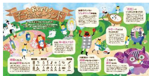
pp.12-13 おくすりそうなんだーランド

アイセイ薬局は創業40周年を記念し、健康情報誌『ヘルス・グラフィックマガジン（以下、HGM）』特別号「薬局をもっと身近に」を発行しました。HGMは予防医療のための有益な情報や、セルフケアに役立つ健康情報を、当社の強みである「デザインの力」を発揮して、わかりやすく魅力的に紹介する季刊フリーペーパーです。「カタい」「むずかしい」と敬遠されがちな医療・健康情報を“正しく・わかりやすく・楽しく伝える”ことにこだわってきました。