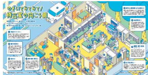
pp.4-5 のぞいてみてみて! 待合室の向こう側