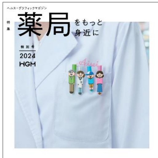
HGM 特別号「薬局をもっと身近に」表紙