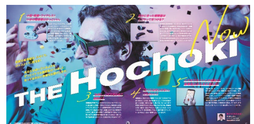
pp.10-11 THE Hochoki Now

老化現象のひとつとして誰にでも自然に起こる加齢性難聴。日常生活に不便を感じ始めたら、補聴器の活用がオススメです。「うっとうしい」などネガティブなイメージもあるかもしれませんが、補聴器は快適な生活やコミュニケーションの強い味方。補聴器にまつわる誤解や活用方法、実はカッコイイ最新の補聴器事情もご紹介します。正しく知れば、きっと、補聴器をもっと身近に感じるはずです。