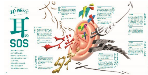
pp.8-9 耳を傾けよう！ 耳のSOS