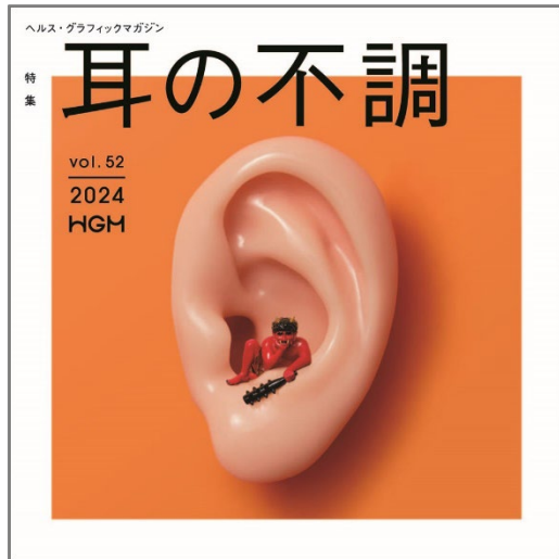
HGM Vol.52「耳の不調」号 表紙