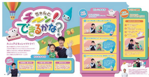
pp.16-17 ちゃんとチーン! できるかな?

アイセイ薬局は12月15日、健康情報誌『ヘルス・グラフィックマガジン（以下、HGM）』Vol. 46「かぜ」号を発行しました。HGMは毎号ひとつの症状にフォーカスし、医師や専門家監修のもと、メカニズム・改善方法・発症リスクなどをこだわりぬいたクリエイティブで解説する季刊フリーペーパーです。