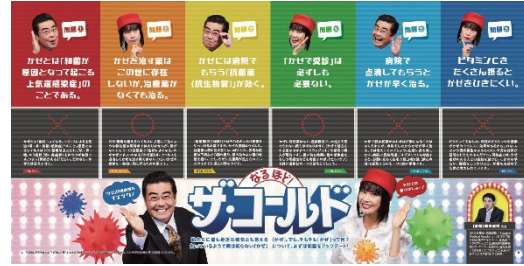
pp.4-5 なるほど! ザ・コールド