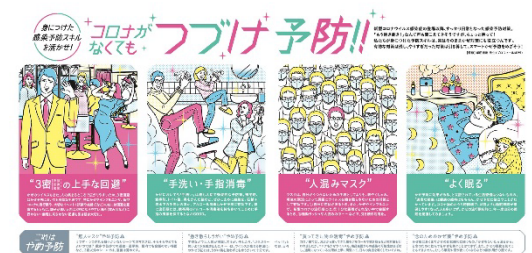
pp.6-7 コロナがなくてもつづけ予防!!

HGM ではやりすぎや効果が薄いという対策は引き算して、有効な対策を上手に取り入れることをおすすめしています。